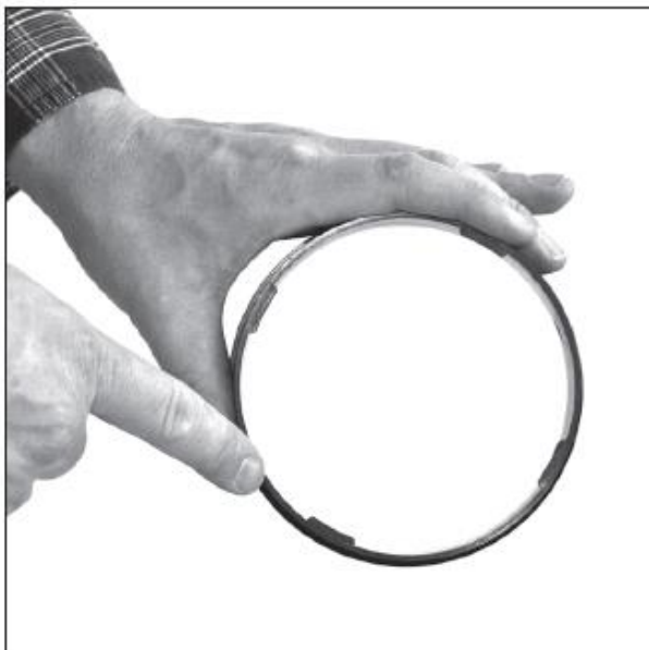
Адаптер быстрой фиксации. Примите во внимание положение байонетных замков.