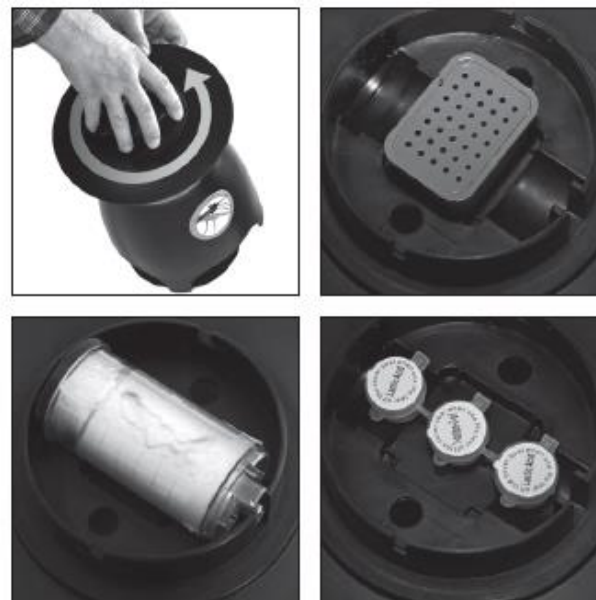
Для открытия отсека приманки: Нажмите и поверните против часовой стрелки.