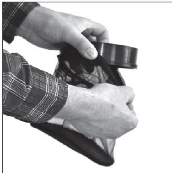
Присоедините сетку к адаптеру быстрой фиксации.