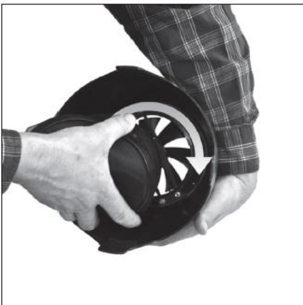
Поместите адаптер быстрой фиксации по направлению к ободу вентилятора и поверните по часовой стрелке.